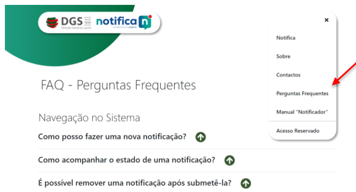
Figura 1 – Perguntas Frequentes

Antes de realizar a sua notificação e caso tenha dúvidas, poderá consultar no canto superior direito, o Menu onde constam as Perguntas Frequentes.