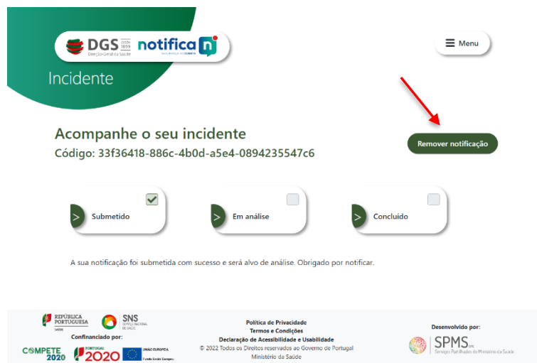
Figura 15 - Eliminar uma notificação

Passo 1 - É possível eliminar uma notificação durante as primeiras 24h após a sua submissão. Para tal, na página inicial selecionar “Acompanhe aqui o estado do seu incidente”, introduzir o código alfanumérico da notificação e selecionar o ícone “Remover notificação”. Ver figura abaixo.