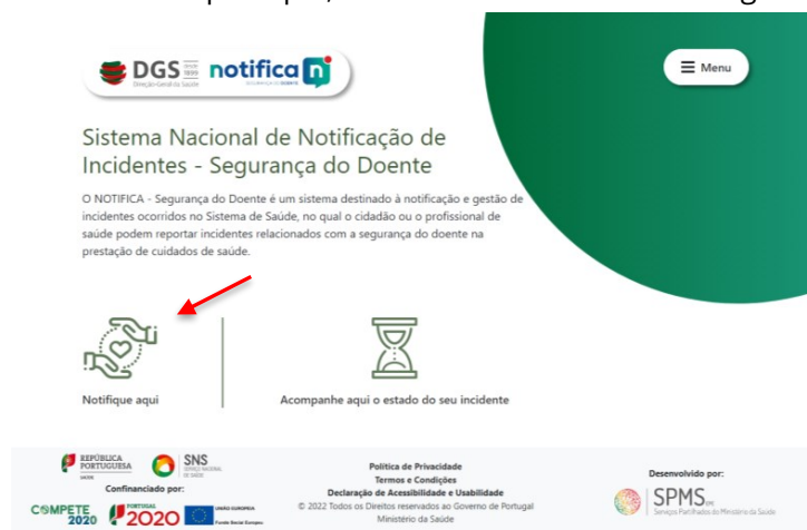
Figura 2 - Página Inicial (Notificar)

Passo 1 - Selecionar o ícone “Notifique aqui”, conforme mostra a seta na figura abaixo.