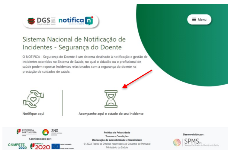
Figura 11 - Página Inicial (Estado do incidente)

Passo 1 - Seleccionar o ícone “Acompanhe aqui o estado do seu incidente”, conforme mostra a figura abaixo.