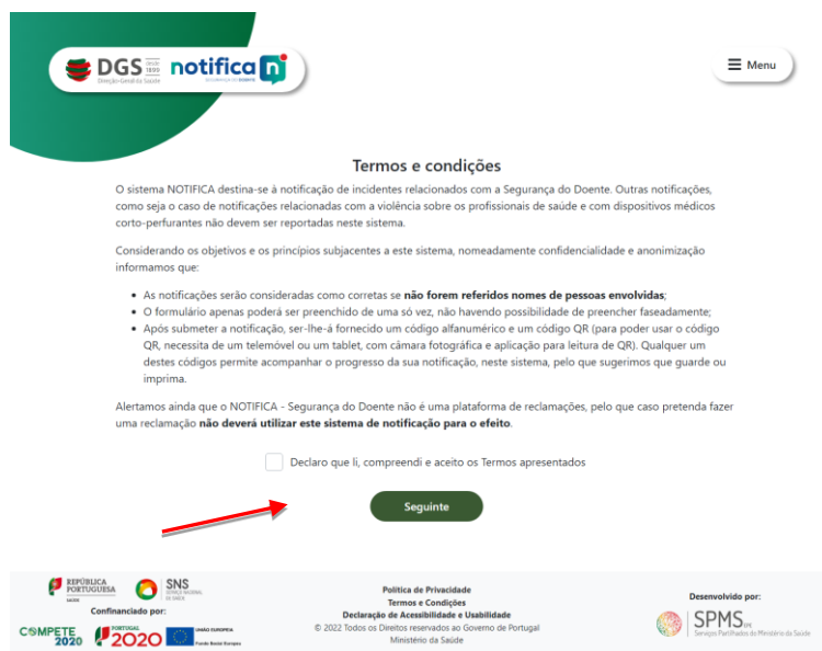
Figura 3 - Termos e condições

Passo 2 - Aceitar os termos e condições do NOTIFICA - Segurança do Doente, e selecionar “Seguinte” para continuar.