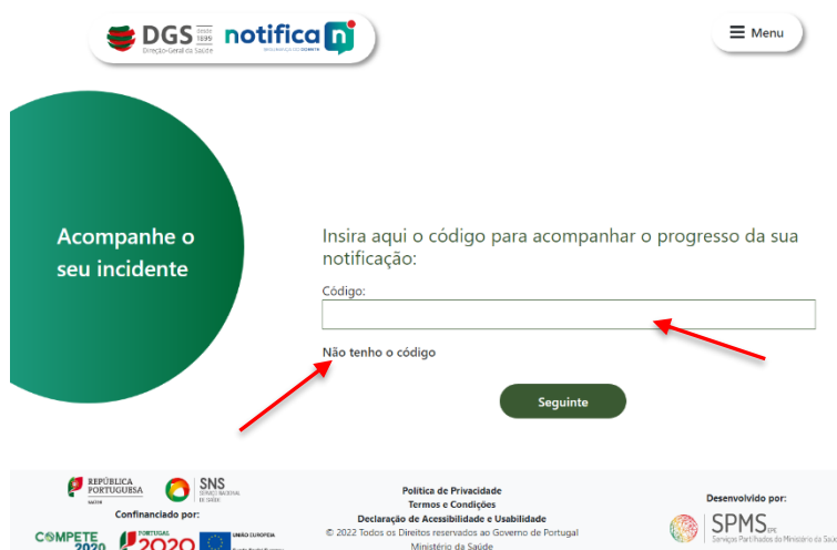
Figura 12 - Preenchimento do código do incidente

Passo 2 - Preencher o campo “Código” com o código alfanumérico da notificação que guardou e de seguida seleccionar “Seguinte”. Se não se lembrar do código da notificação, seleccionar “Não tenho o código”. (Ver questão “Obter código de incidente” mais à frente neste Manual).