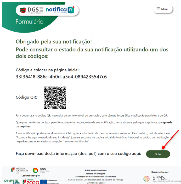
Figura 10 - Notificação Submetida